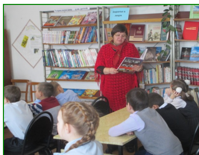
Викторина о Курганской области прошла в школьной библиотеке.