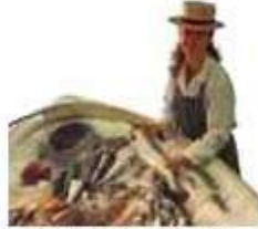
la marchande de poissons fish-seller