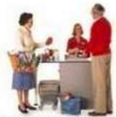
l'employée de magasin sales clerk