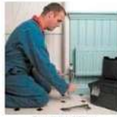
le plombier plumber