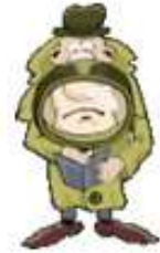
Un inspecteur ou un détective (privé)