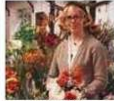
la fleuriste florist