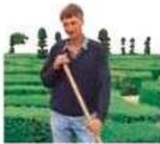
le jardinier gardener