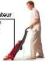
le nettoyeur cleaner