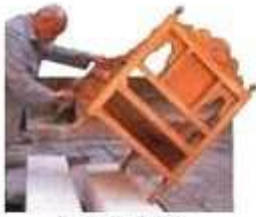
le menuisier carpenter