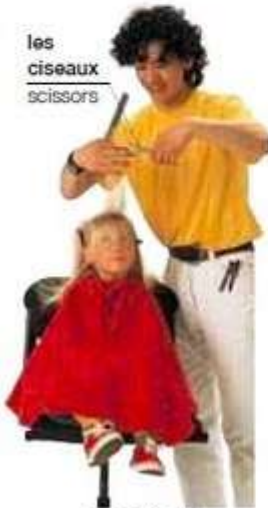
le coiffeur hairdresser