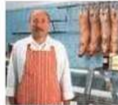
le boucher butcher