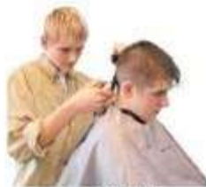
le coiffeur barber