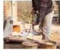
le maçon construction worker