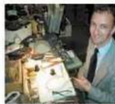
le bijoutier jeweler