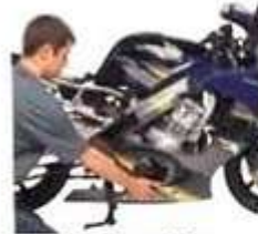
le mécanicien mechanic