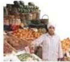
le marchand de légumes produce-seller